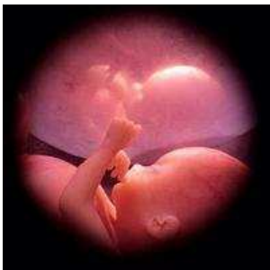
vanuit de moederschoot een besneden hart