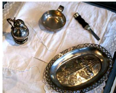
besnijdenis van de voorhuid door mensen handen